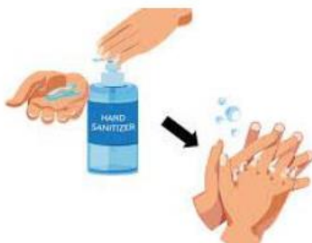
TANGAN DI SANITASI