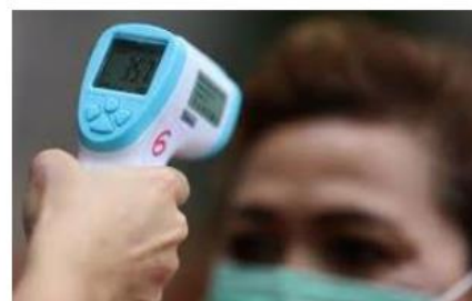
SUHU BADAN NORMAL