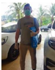
SEORANG SAHAJA YANG DIBENARKAN KELUAR DARIKADA KENDERAAN