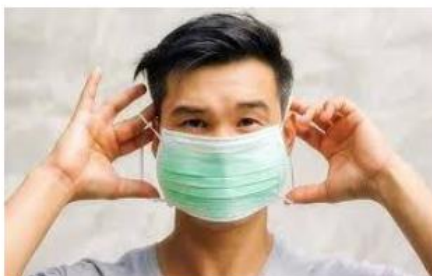
WAJIB MEMAKAI PENUTUP MULUT DAN HIDUNG