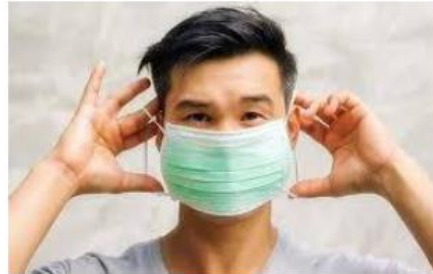
WAJIB MEMAKAI PENUTUP MULUT DAN HIDUNG