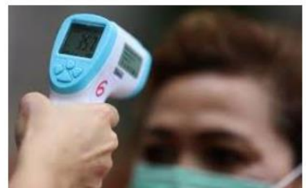
SUHU BADAN NORMAL