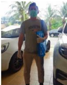
SEORANG SAHAJA YANG DIBENARKAN KELUAR DARIPADA KENDERAAN