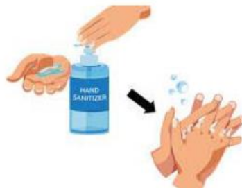
TANGAN DI SANITASI